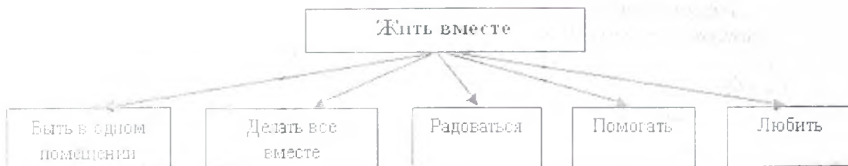
Рисунок 3.1. – Кластер №1 «Жить вместе»